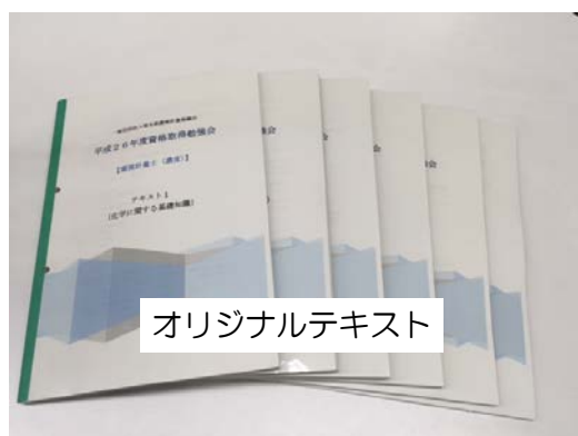
オリジナルテキスト

平成27年度は、平成26年度に引き続き「環境計量士（濃度）」を対象に資格試験勉強会を開催しますので、是非ともご参加ください。