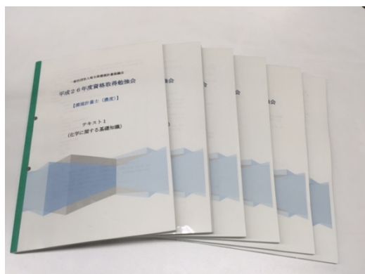
オリジナルテキスト

なお、現行方式の資格試験勉強会開催は今回が最後となりますので、環境計量士取得を目指している方は是非ともご参加ください。