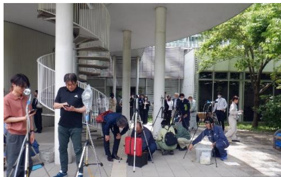
モニタリング準備